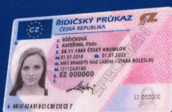
vzor nového řidičského průkazu