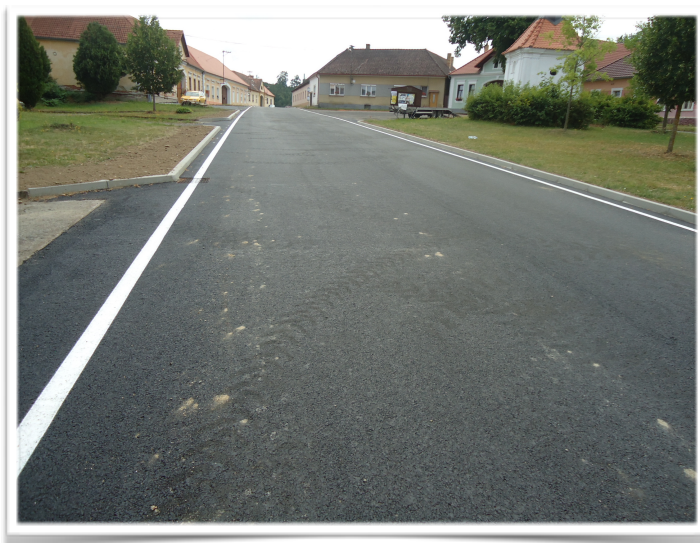
Opravená komunikace v Podeřístích