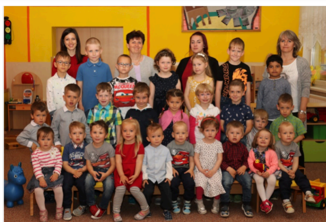
Mateřská škola Malovice 2018/2019

Děni ve školce v II. pololetí školního roku: