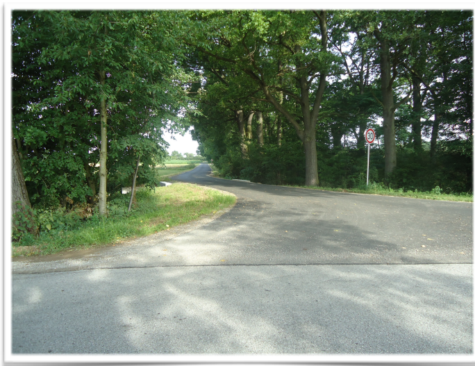
Nová komunikace z Maloviček do Nestanic