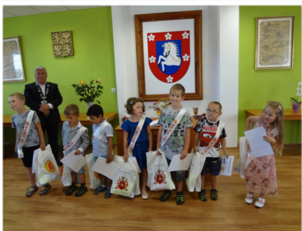
Foto absolventů mateřské školy z rozlučkové slavnosti na Obecním úřadě v Malovicích a společné foto školního roku.

Celý školní rok byl poměrně klidný a bohatý na dění v naší školce. Do školky nastoupilo 28 dětí. V malé třídě "Sluníček" ( od 2 do 4 let) bylo přihlášeno 13 dětí. O takto malé děti se starala p. učitelka spolu s chůvou. Na tuto personální podporu jsme získali peníze z projektu Šablony II, který je určen pro mateřské školy. Tento projekt nám pomůže ještě v dalším školním roce, protože opět otevřeme třídu našich nejmenších (od 2 let). Ve velké třídě „Kluků a holčiček“ (od 4 do 7 let) bylo přihlášeno 15 dětí. V této třídě bylo 10 předškoláků z nich 7 dětí půjde do základní školy. O tyto děti se též staraly dvě pracovnice - p. učitelky.