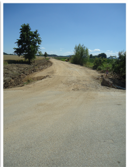
Komunikace z Podeřístě na Malovice a Malovičky