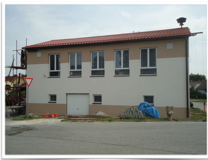
Oprava střechy a fasády KD Krtely